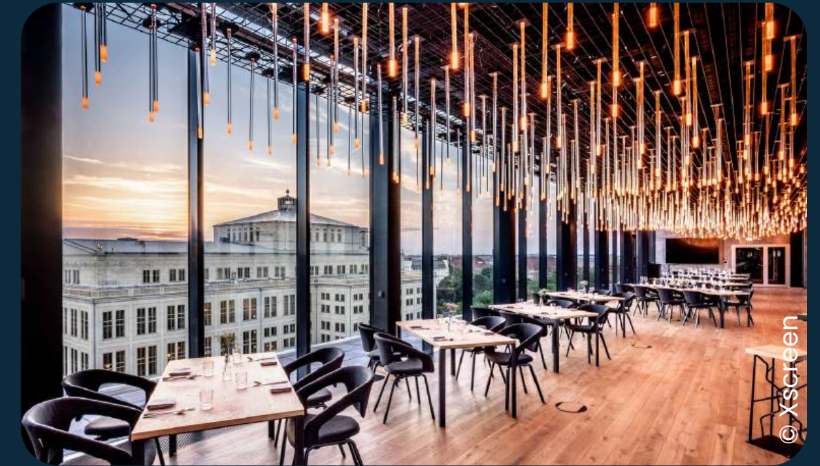
Staycity Aparthotels Leipzig City Centre