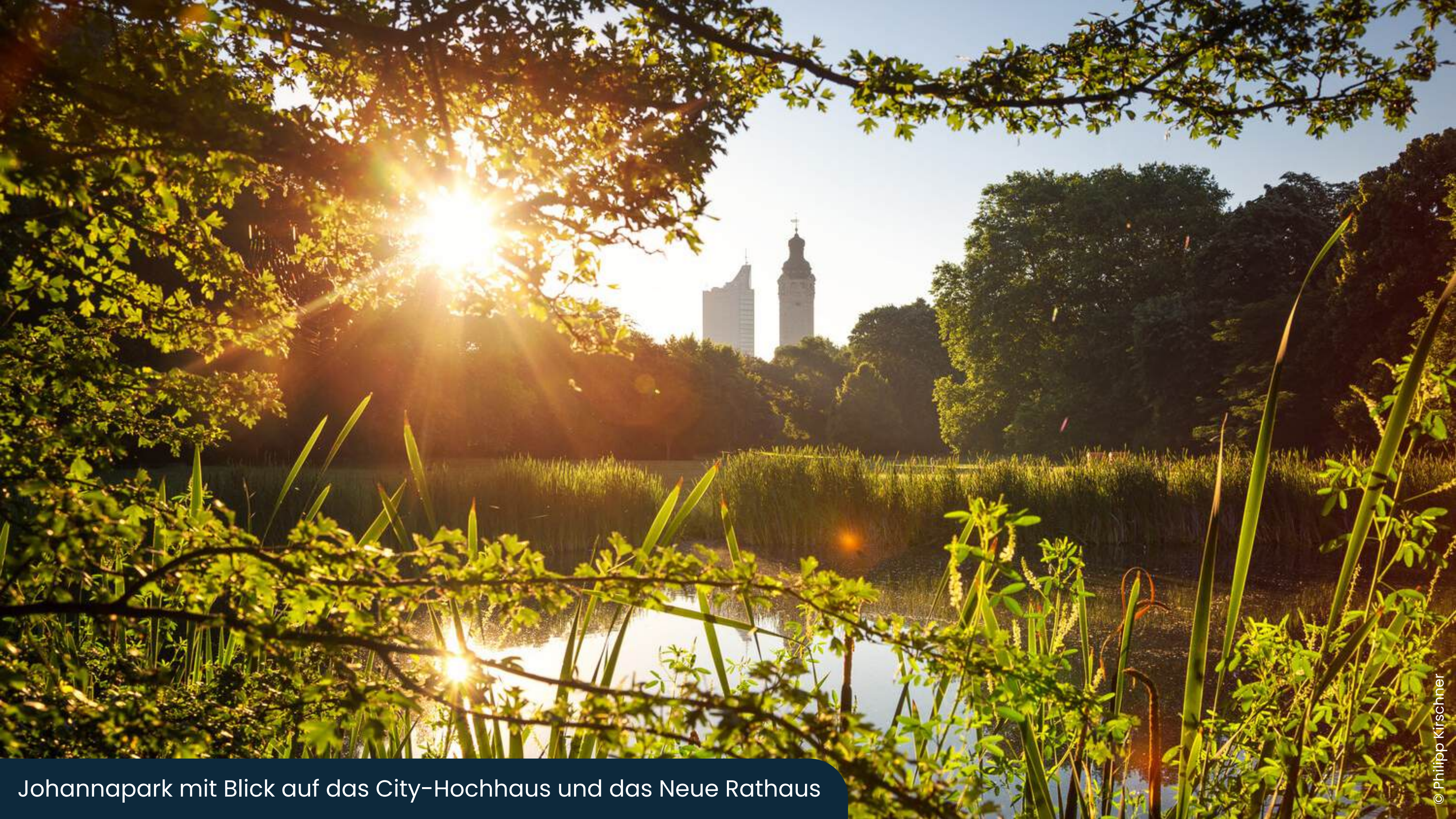
Johannapark mit Blick auf das City-Hochhaus und das Neue Rathaus