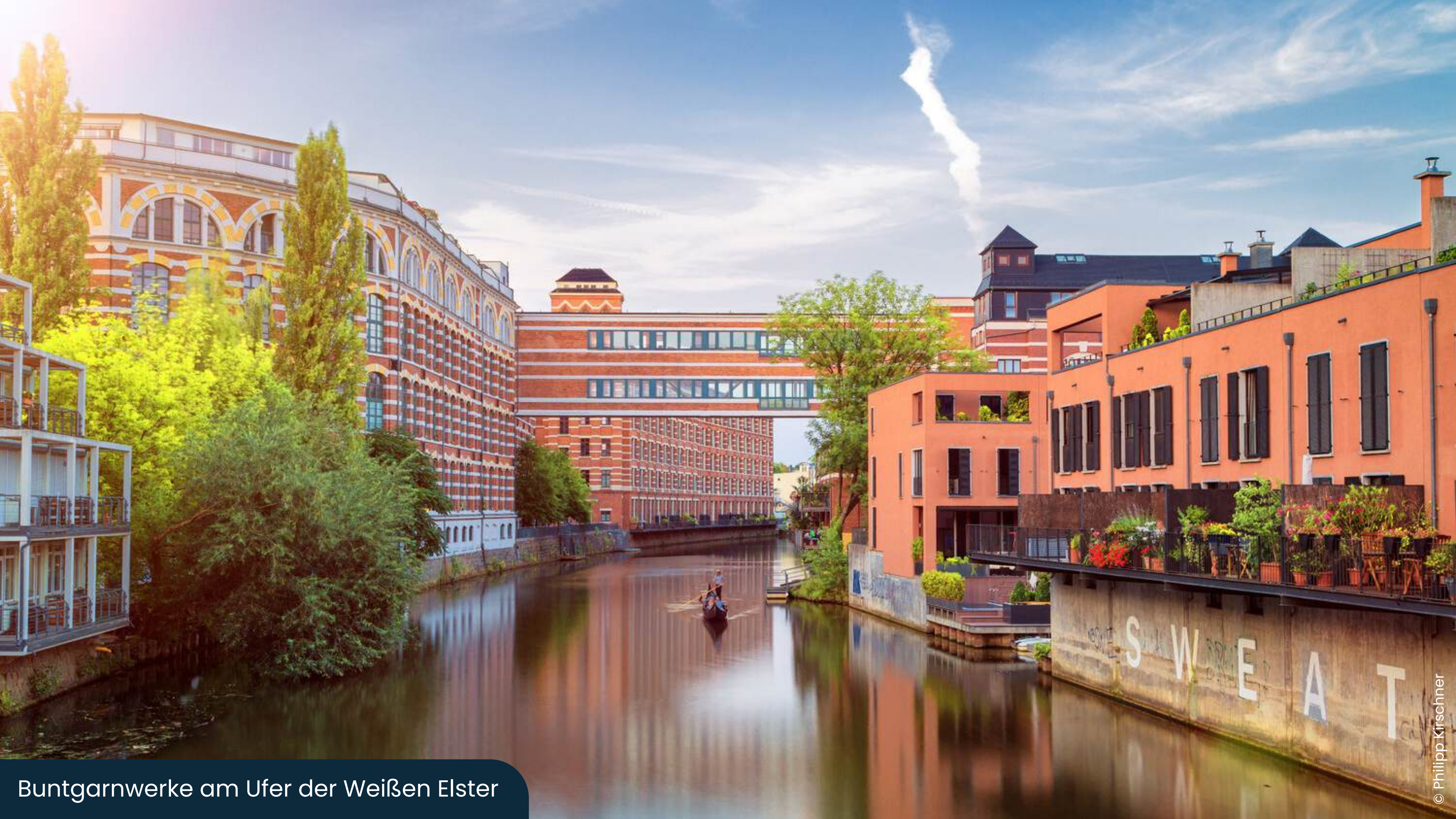
Buntgarnwerke am Ufer der Weißen Elster