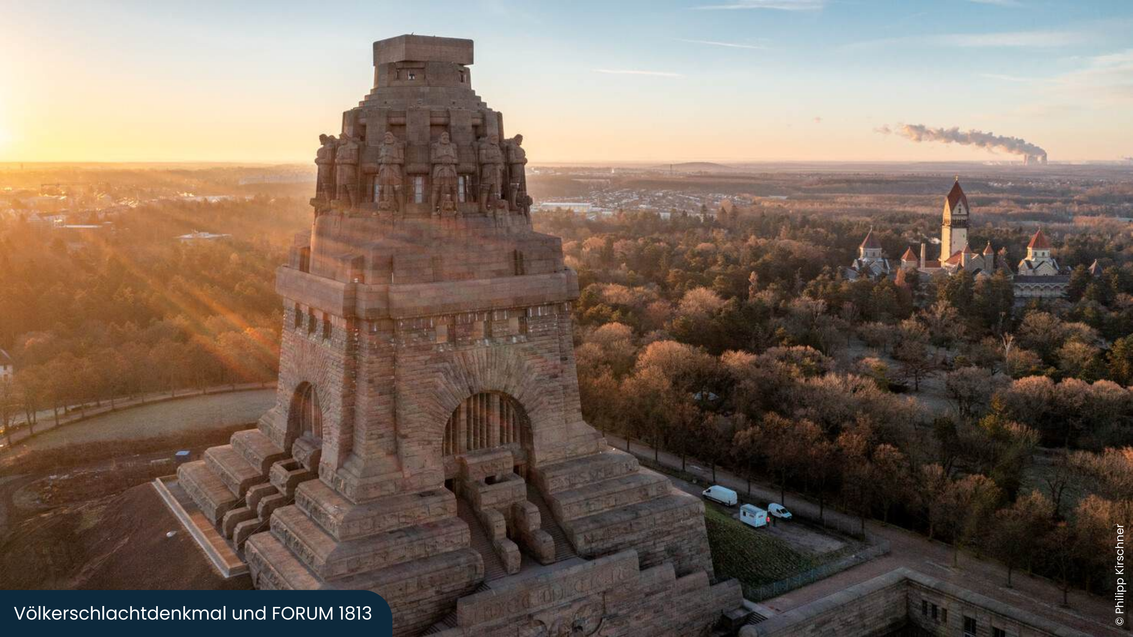
Völkerschlachtdenkmal und FORUM 1813