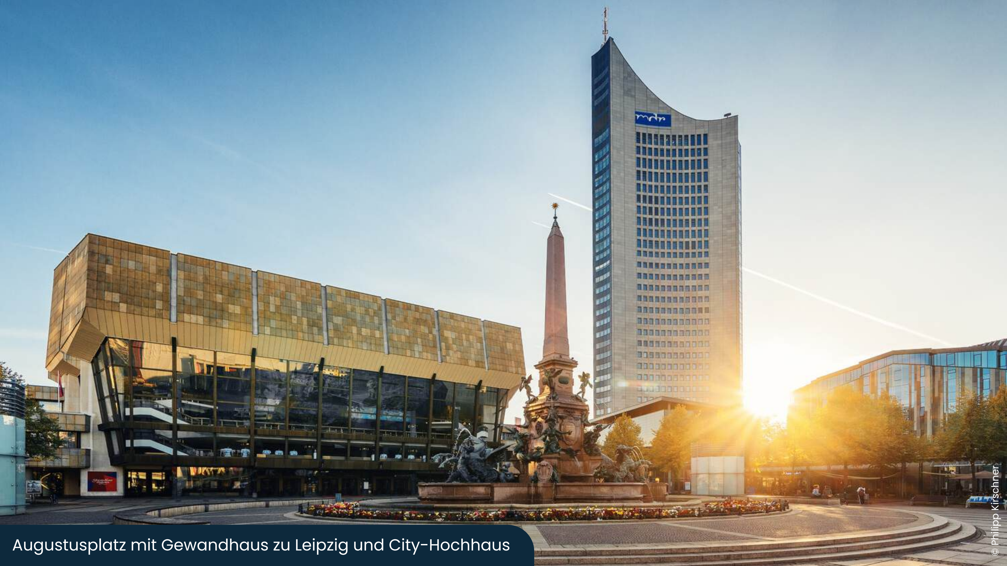
Augustusplatz mit Gewandhaus zu Leipzig und City-Hochhaus