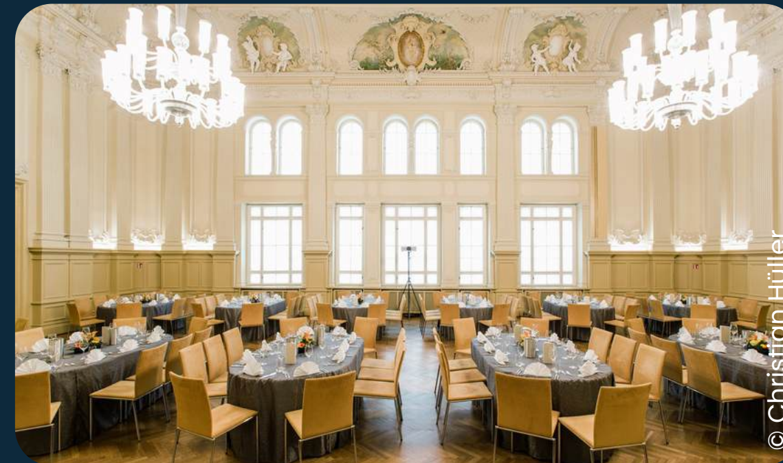
Salles de Pologne