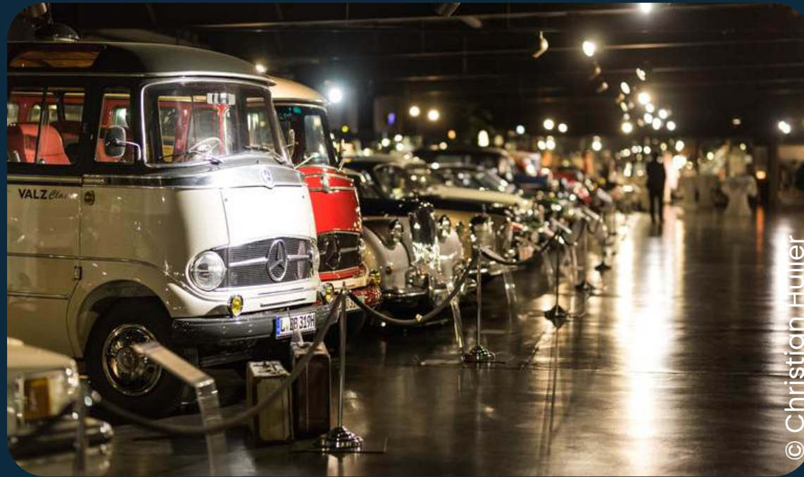
Da Capo Oldtimermuseum & Eventhalle